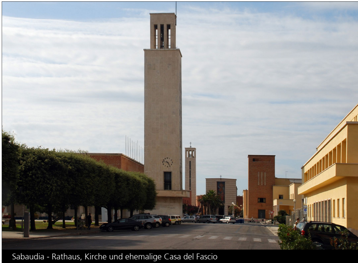
Sabaudia - Rathaus, Kirche und ehemalige Casa del Fascio